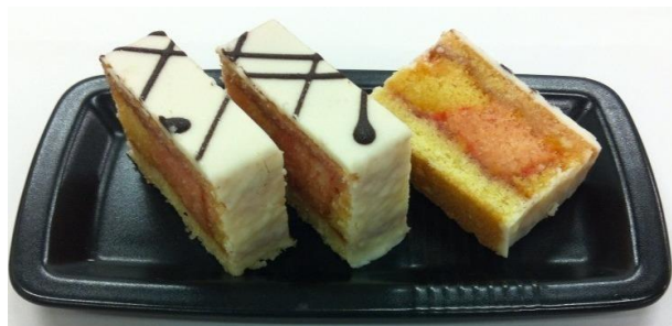
8005 Punčový řez s jogurt. polevou