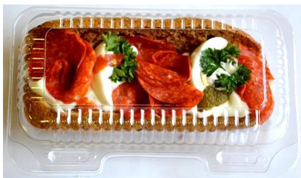
3205 Bageta s čabajkovým salámem