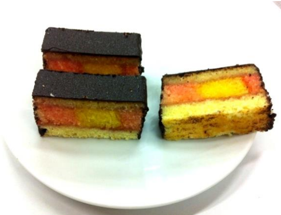
8004 Punčový řez s tm. polevou