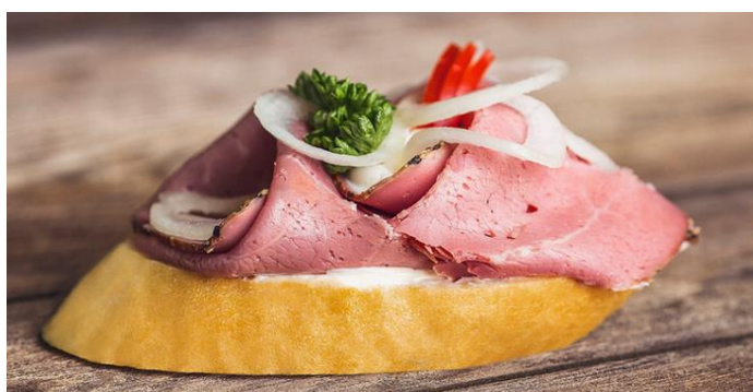
130 Chlebíček s à la roastbeefem