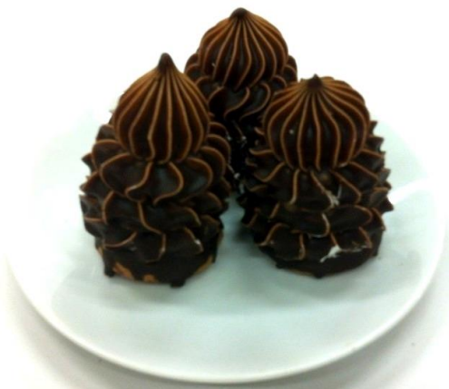
8006 Indian s tm. polevou