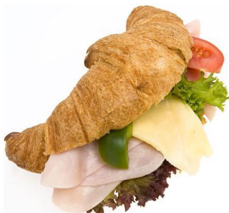
3212 Croissant s krůtí šunkou