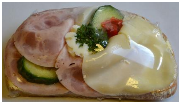
3340 Obl. chléb se šunkovým salámem a sýrem