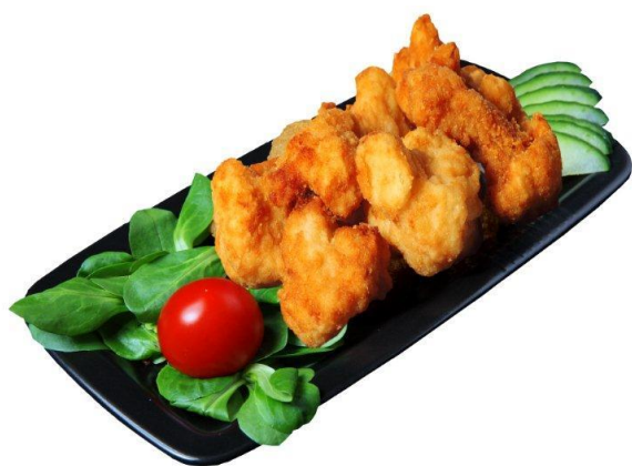
9028 Smažený květák