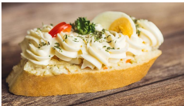
3150 Chlebíček vajíčkový