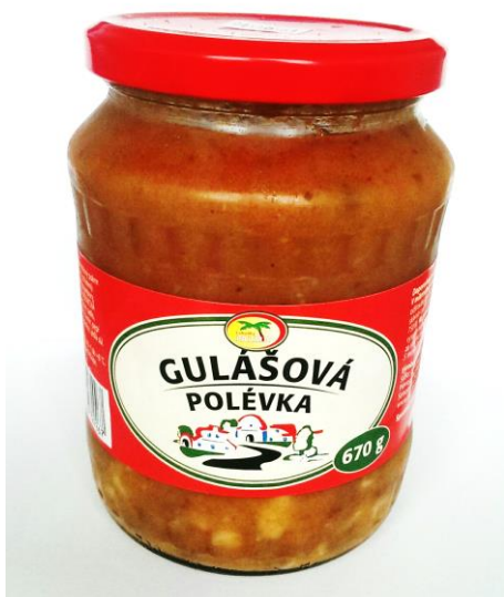
6101 Gulášová polévka