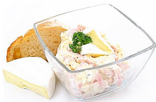
1305 Hermelínový salát Palmeta