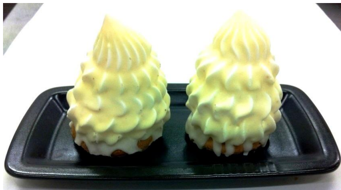
8007 Indian s jogurt. polevou