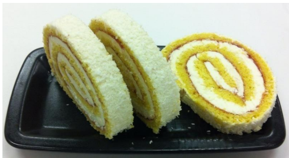
8008 Roláda kokosová