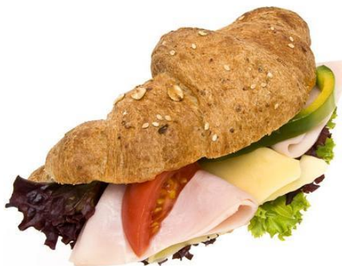
3213 Celozr. croissant s krůtí šunkou a sýrem