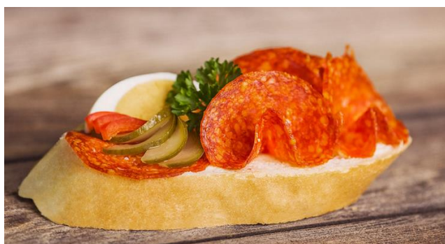
3170 Chlebíček čabajkový