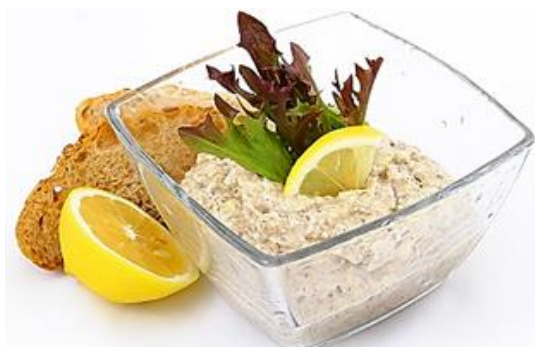
1362 Sardinková pomazánka Palmeta