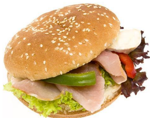
3215 Hamburger s pršutem